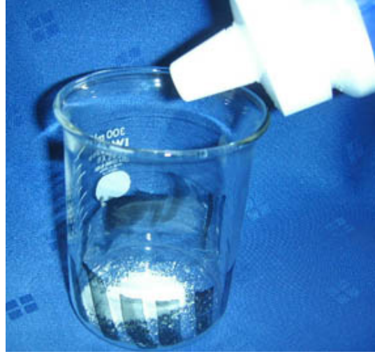
② Uクリーンを入れる