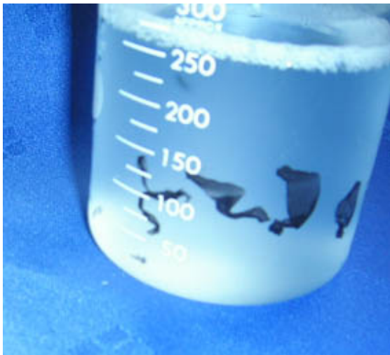
⑤ 剥離されたマジックの様子