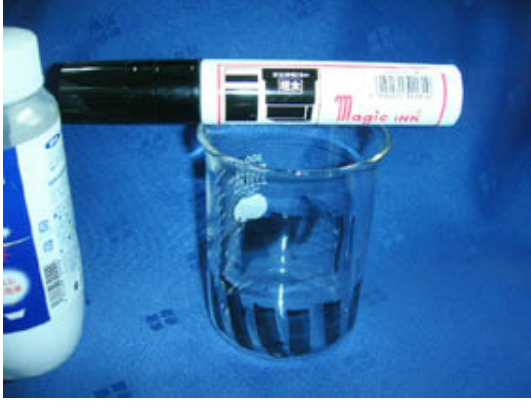
① マジックで内側に書く