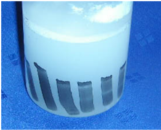
③ 70度のお湯を入れる